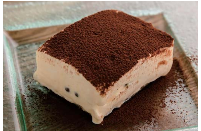
Tiramisu ティラミス 680 (税込748)

1 Flavor 230 (税込253) 2 Flavors 440 (税込484) 3 Flavors 650 (税込715)