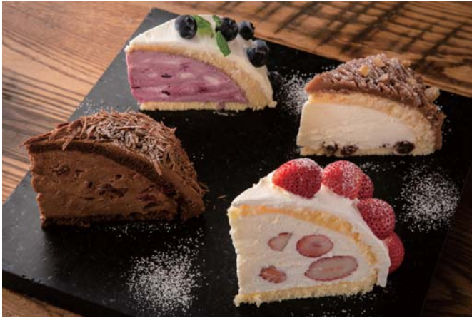
Seasonal Cake -Zuccotto- 季節のケーキ ~ズコット~ ASK