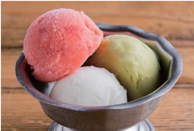
Seasonal Gelato 季節のジェラート

1 Flavor 230 (税込253) 2 Flavors 440 (税込484) 3 Flavors 650 (税込715)