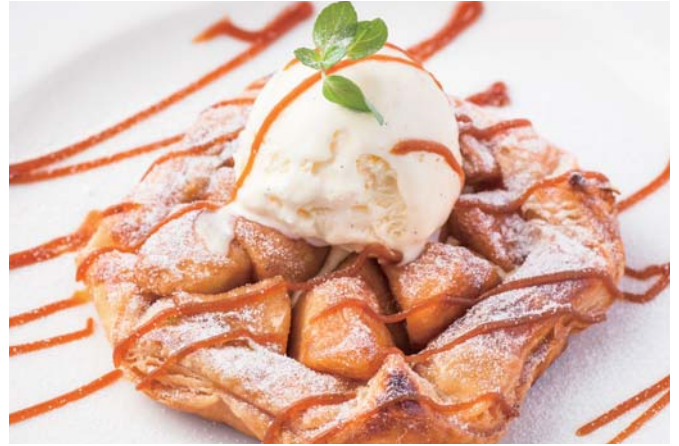
La Boheme Apple Pie アップルパイ 880 (税込968)