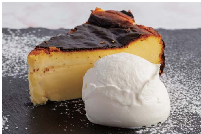
バスクチーズケーキ