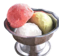
Gelato ジェラート(3種類選べます) Pistachio, Amaou, Setouchi Lemon ピスタチオ・あまおう・瀬戸内レモン