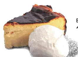
Basque Cheesecake バスクチーズケーキ

アルコールを使用しています This dessert contains alcohol