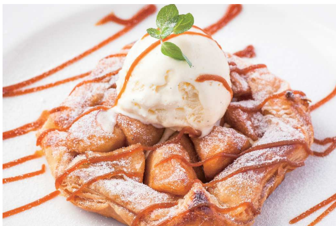
La Boheme Apple Pie アップルパイ

※内容は季節によって変わります。スタッフにお尋ねください。 The menu changes depending on the season.