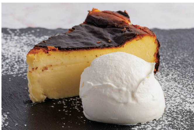
Basque Cheesecake バスクチーズケーキ