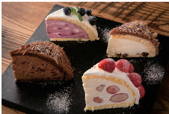
Zuccotto ズコット 850 (税込935)