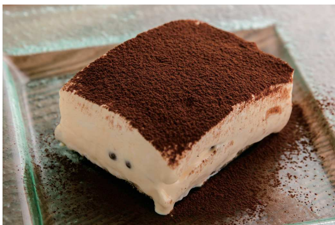
Tiramisu ティラミス 650 (税込715)

チョコレートクラッカーのサクサクした食感と北海道産マスカルポーネチーズのクリーミーな味わいをお楽しみください