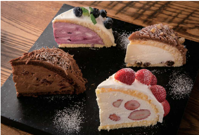
Seasonal Cake -Zuccotto-