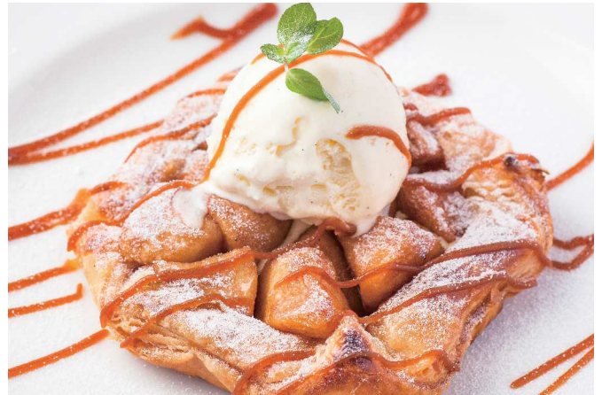
La Boheme Apple Pie