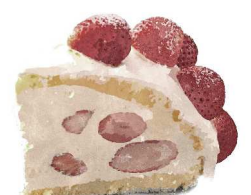
Seasonal Cake -Zuccotto- 季節のケーキ〜ズコット〜 ASK