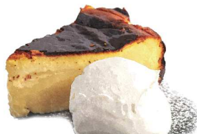
Basque Cheesecake バスクチーズケーキ

This dessert contains alcohol アルコールを使用しています