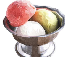
Seasonal Gelato 季節のジェラート(3種類選べます)