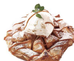
Apple Pie アップルパイ +250(税込275)