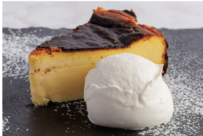
バスクチーズケーキ Basque Cheesecake