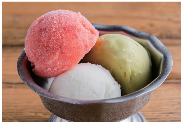
季節のジェラート Seasonal Gelato

1 Flavor 230 (税込 253) 2 Flavors 440 (税込 484) 3 Flavors 650 (税込 715)