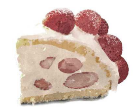
Seasonal Cake - Zuccotto 季節のケーキ〜ズコット〜 +300(330)