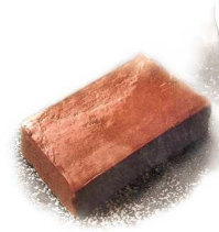
Chocolat Terrine with Pistachio Gelato ショコラのテリーヌ ピスタチオのジェラート +200(220)