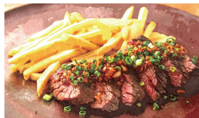
U.S. Prime Beef Steak USプライムビーフステーキ