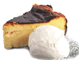
Basque Cheesecake バスクチーズケーキ