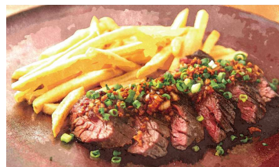
U.S. Prime Beef Steak USプライムビーフステーキ