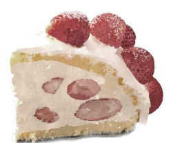
Seasonal Cake - Zuccotto 季節のケーキ〜ズコット〜 +300(330)