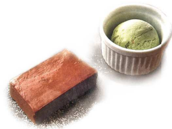
Chocolat Terrine with Pistachio Gelato ショコラのテリーヌ ピスタチオのジェラート +200(220)