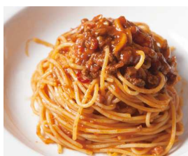
Bolognese ボロネーゼ 【おすすめトッピング 温泉卵】