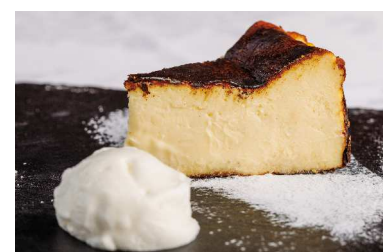
Basque Cheesecake バスクチーズケーキ