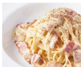
Carbonara カルボナーラ 【おすすめトッピング 生ハム】