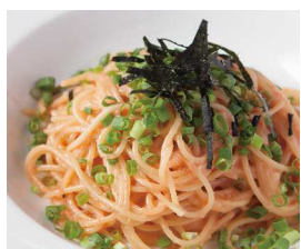
Mentaiko 元祖辛子明太子 【おすすめトッピング 青じそ】