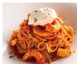
Shrimp & Mascarpone with Tomato Sauce 小海老とマスカルポーネの トマトソース +¥200 (税込220)