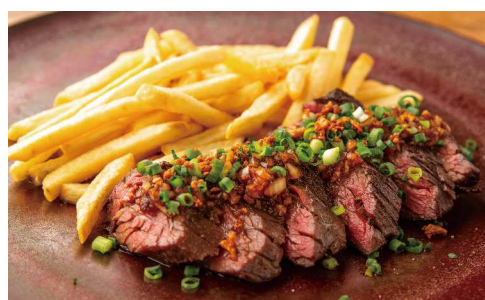
U.S. Prime Beef Steak USプライムビーフステーキ