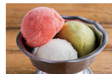
Gelato 2 Scoop ジェラート 2種類選べます Pistachio, Strawberry, Organics Lemon & Ginger ピスタチオ・あまおう・有機レモンと黄金しょうが