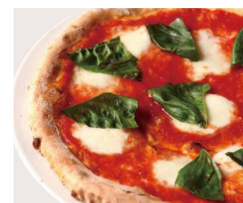
Margherita 水牛モzzarella使用 パスタをマルゲリータピッツアに 変更可能 +¥400 (税込440) You can change pasta to margherita pizza