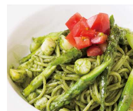
Genovese アスパラガスと小柱の ジェノバソース +¥300 (税込330) 【おすすめトッピング ベーコン】