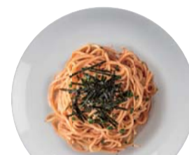
元祖辛子明太子 ¥850 Mentaiko 【おすすめトッピング: 青じそ】