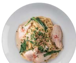
蒸し鶏と青ネギの和風ソース ¥850 Steamed Chicken 【おすすめトッピング: 大根おろし】