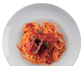
アラビアータ ¥750 Arrabbiata 【おすすめトッピング: 茄子】