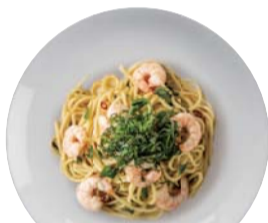
小海老と青じそ ¥850 Shrimp & Aojiso 【おすすめトッピング: 大根おろし】