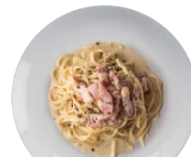
カルボナーラ ¥950 Carbonara 【おすすめトッピング: ほうれん草】