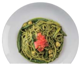
アスパラガスと小柱の ジェノバソース ¥1,250 Genovese