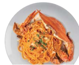
渡り蟹の トマトクリームソース ¥1,450 Blue Crab & Tomato Cream