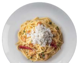
釜揚げしらすのペペロンチーノ ¥850 Peperoncino with Whitebait 【おすすめトッピング: ほうれん草】