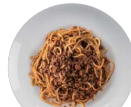
ボロネーズ ¥1,250 Bolognese 【おすすめトッピング: 温泉卵】