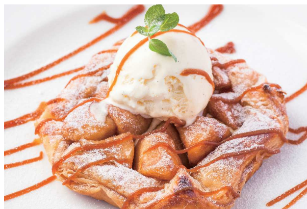
La Boheme Apple Pie アップルパイ 700 (税込770)

(Strawberry / Blueberry / Montblanc / Chocolate & Cherry)