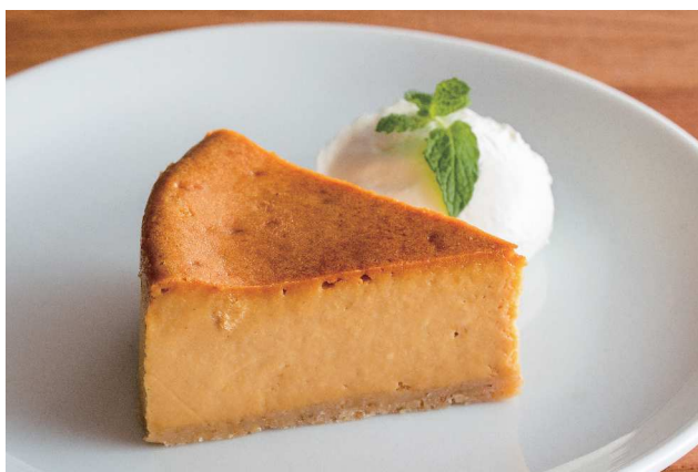
Caramel Cheesecake キャラメルチーズケーキ 550 (税込605)

チョコレートクラッカーのサクサクした食感と北海道産マスカルポーネチーズのクリーミーな味わいをお楽しみください