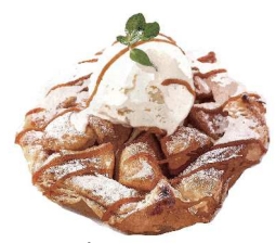
Apple Pie アップルパイ +200(税込220)