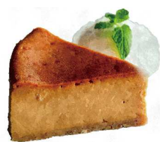
Caramel Cheesecake キャラメルチーズケーキ