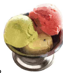
Gelato ジェラート(2種類選べます) Pistachio, Strawberry, Passion Fruit ピスタチオ・あまおう・パッションフルーツ