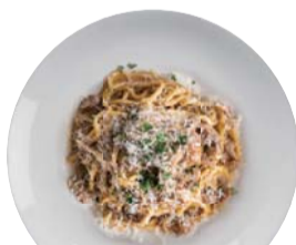
ポルチーニ茸の クリームソース ¥1,350 Porcini Mushroom Cream Sauce