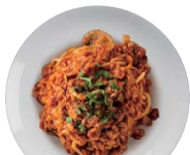
レンコンと大豆ミートの ヴィーガンボロネーズ ¥1,050 Vegan Bolognese with Lotus Root & Soy Meat