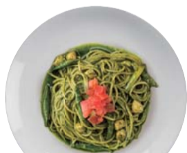
アスパラガスと小柱の ジェノバソース ¥1,250 Genovese