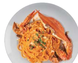
渡り蟹の トマトクリームソース ¥1,450 Blue Crab & Tomato Cream