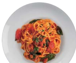
完熟トマトとモッツアレラ ¥1,150 Tomato & Mozzarella