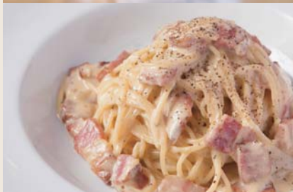
Carbonara カルボナーラ 【おすすめトッピング 明太子 +¥250】