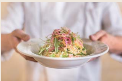
Weekly Special 今週のおすすめパスタ 内容はスタッフにお尋ね下さい

Lunch Beer / Glass Wine Red or White ランチビール、グラスワイン 赤・白