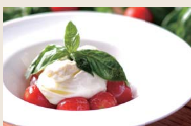
Caprese ブラータチーズのカプレーゼ ¥1,200