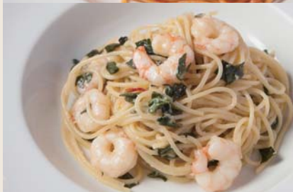
Shrimp & Aojiso 小海老と青じそ 【おすすめトッピング 大根おろし +¥150】