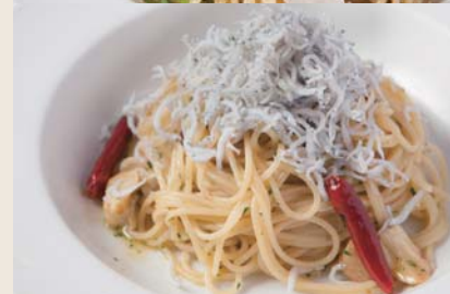
Peperoncino with Shirasu 釜揚げしらすの ペペロンチーノ 【おすすめトッピング 小ヤリイカ +¥250】