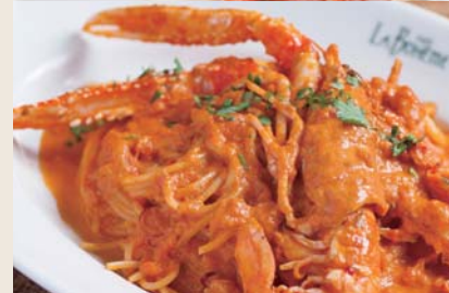
Scampi with Tomato Cream Sauce 手長海老の トマトクリームソース (+¥450)