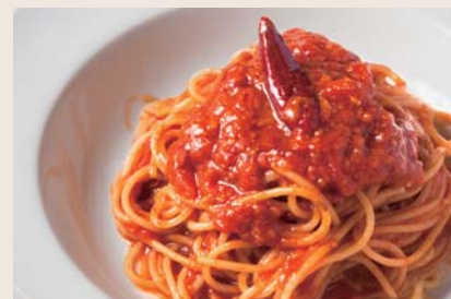
Arrabbiata アラビアータ 【おすすめトッピング 茄子 +¥250】