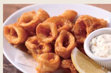
Deep-fried Calamari 小ヤリイカのリング揚げ ¥680