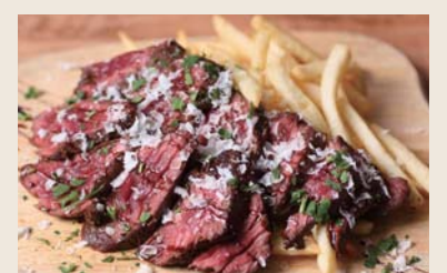
U.S. Prime Beef Steak USプライムビーフステーキ S ¥1,680 / L ¥2,980