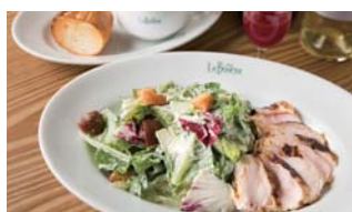
Grilled Chicken Salad Plate グリルチキンサラダプレート

Chicken Salad + Baguette + Drink ¥1,200 チキンサラダ + バゲット + ドリンク