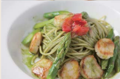
Genovese 帆立とアスパラガスの ジェノバソース (+¥250)