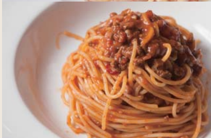
Bolognese ポロネーズ 【おすすめトッピング 温泉卵 +¥150】