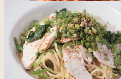
Steamed Chicken 蒸し鶏と青ネギの和風ソース 【おすすめトッピング 大根おろし +¥150】