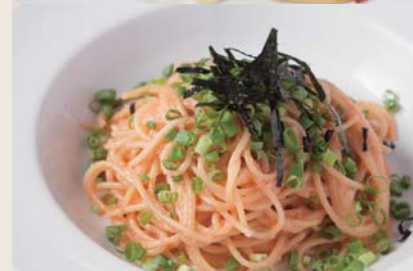
Mentaiko 辛子明太子あえ 【おすすめトッピング 小ヤリイカ +¥250】