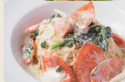
Salmon & Spinach with Cream Sauce サーモンとほうれん草の クリームソース (+¥250)