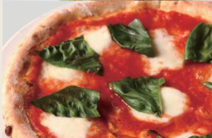
Margherita Pizza マルゲリータ (+¥350)